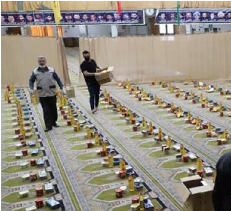
توزیع ۴ هزار بسته معیشتی در طرح رمضان

روزنامه رسمی استان خراسان شمالی Etefaghyeh@gmail.com پست الکترونیک :