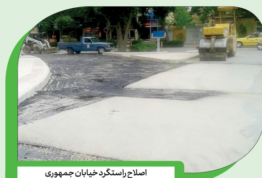
اصلاح راستگرد خیابان جمهوری