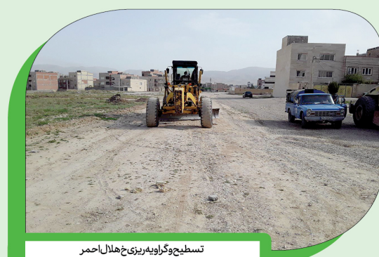
تسطیح و گراویزه ریزی در خیابان هلال احمر