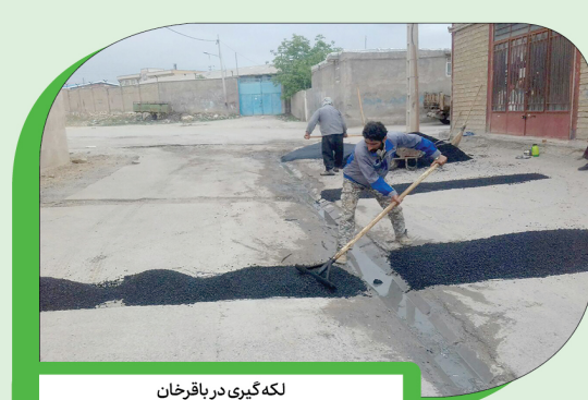
لکه‌گیری در باقرخان