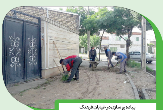
پیاده‌رو سازی در خیابان فرهنگ