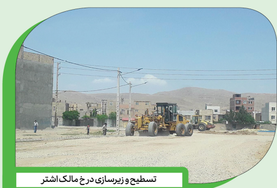
تسطیح و زیرسازی درخ مالک اشتر