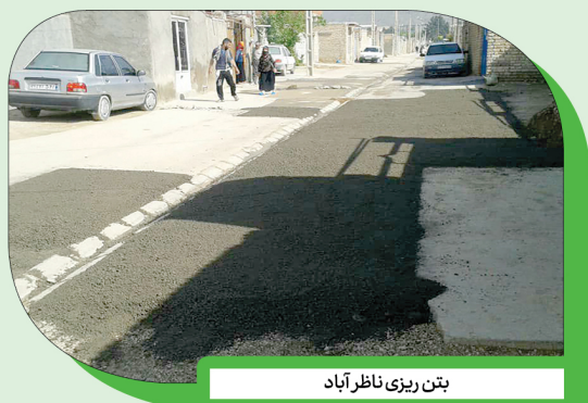
بتن ریزی ناظر آباد