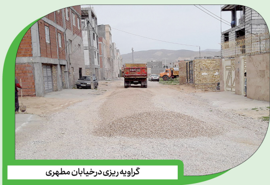
گراویزه ریزی در خیابان مطهری