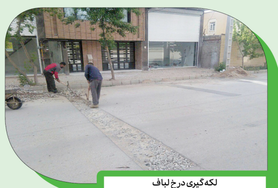
لکه‌گیری درخ لیاف