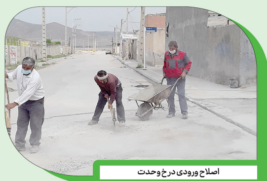
اصلاح ورودی درخ وحدت