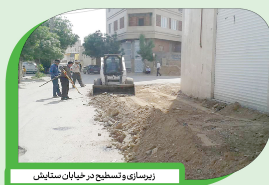
زیرسازی و تسطیح در خیابان ستایش