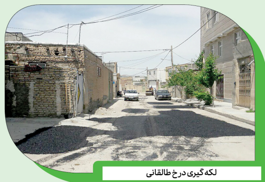
لکه‌گیری درخ طالقانی