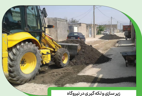
زیر سازی ولکه‌گیری در نیروگاه