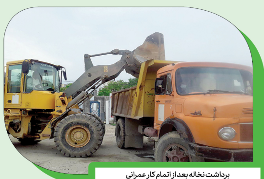
برداشت نخاله بعد از اتمام کار عمرانی