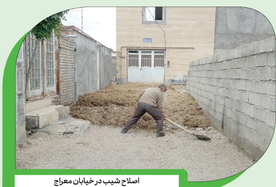
اصلاح شیب در خیابان معراج