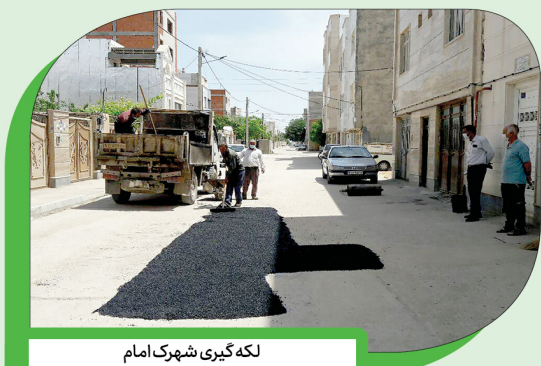
لکه‌گیری شهرک امام