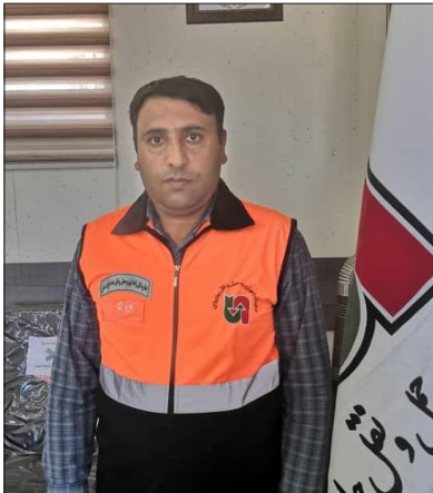
شهرستان شیروان دارای ۵۲۵ کیلومتر راه آسفالتی می باشد که در حدود ۱۸٫۴ درصد طول راههای خراسان شمالی است.

مدیر راهداری و حمل و نقل جاده ای شیروان گفت: ۱۷ نقطه پرتصادف در جاده های این شهرستان شناسایی شده بود که تمامی این نقاط آشکار سازی و ایمن سازی اولیه انجام وطنی یک سال آتی بطور کامل ایمن سازی و رفع خواهد شد. مهندس جوان اظهار داشت: نقاط پرتصادف در چند سال گذشته شناسایی شد و این نقاط در بزرگراه آسیایی، اوغاز، گلپای و لوجلی رفع شده است. وی با اشاره به اجرای خط کشی سرد و گرم در طول ۲۸۰ کیلومتر جاده های شهرستان در سال گذشته افزود: این طرح امسال در ۵۰۰ کیلومتر اجرا می شود. وی ایمن سازی و نصب حفاظ بر روی چهار دستگاه پل بزرگ، تهیه و نصب و بهسازی سه هزار عدد علائم ایمنی راه ها و نگهداری و نصب تابلو اطلاعاتی ۲۰۰ مترمربع را از برنامه های امسال عنوان کرد. جوان اجرای روشهای در جاده ها را از برنامه ها برای ارتقای ایمنی تردد جاده ای عنوان کرد و افزود: این