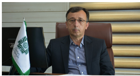
اظهارنامه مالیاتی عملکرد سال ۱۳۹۹ خود را در موعد مقرر قانونی تسلیم نمایند و پس از تسلیم اظهارنامه مالیاتی، فرم موضوع بند (۱) این دستورالعمل را قبل از پایان خرداد ماه سال ۱۴۰۰، به عنوان آخرین اقدام تسلیم نمایند و یا در مهلت مقرر، فرم مربوطه را به سازمان امور مالیاتی کشور تسلیم نکنند از شمول این دستورالعمل خارج بوده و با رعایت مقررات مربوطه تعیین خواهد شد.