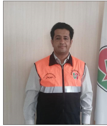
۳ و ۲ کیلومتر روکش راه و لکه گیری کلیه محور ها به صورت کامل در حد توان اداره شهرستان اجرا شده است شهرستان مانه وسملقان دارای ۴۲،۱ کیلومتر بزرگراه - ۲۷۰،۶ کیلومتر راه اصلی - ۹۹،۹ کیلومتر راه فرعی بوده و از ۳۳۸،۴۵ کیلومتر آسفالت راه روستایی برخوردار است.