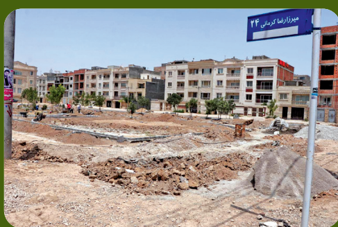
احداث پارک محله در خیابان میرزا رضا کرمانی - اراضی امتداد خیابان شهید صیاد شیرازی