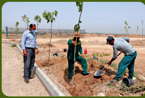
عملیات کاشت نهال در پارک هفت هکتاری شهرک ولی عصر