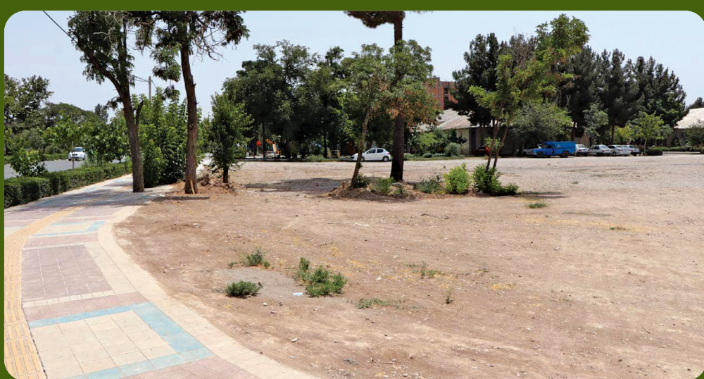
طرح توسعه فرهنگسرا در ایجاد پارک محله

پارک محله در دست مهندسان شهرداری بجنورد در ردیف ایجاد، تجهیز و فضاسازی قرار دادیم. مهندس مهماندوست گفت: اولویت تجهیز پارکها در پارک هفت هکتاری شهرک ولی عصر قرار گرفت و هم اکنون یک هزار اصله نهال توت زاپنی به همت همکاران خوبان در مجموعه در این پارک کاشته شد. وی افزود: انتخاب گونه توت زاپنی به دلیل نیاز آبی کم، رشد سریع، آفت پذیری کم، سایه گستری بالا و رشد