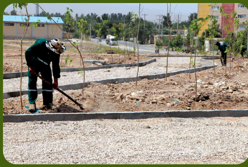
کاشت هزار اصله درخت توت در پارک شهرک ولی عصر