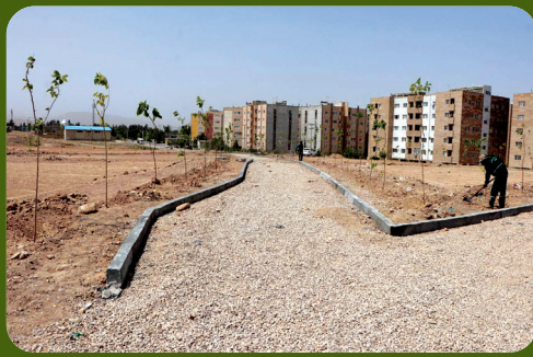
عملیات کاشت درخت در پارک شهرک فرهنگیان