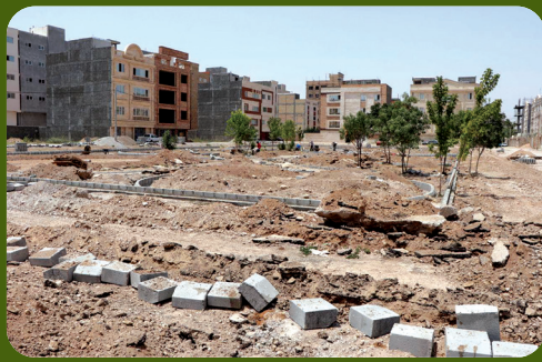
عملیات عمرانی و احداث پارک محله در اراضی قدیم ارتش در خیابان صیاد شیرازی