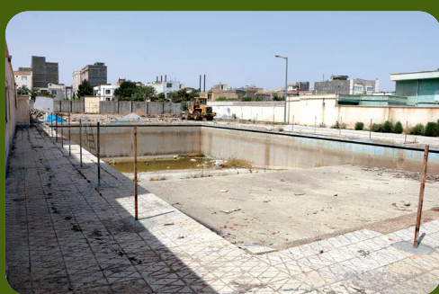
عملیات بهسازی پارک با کاربری خانه هنرمندان در انتهای خیابان فردوسی