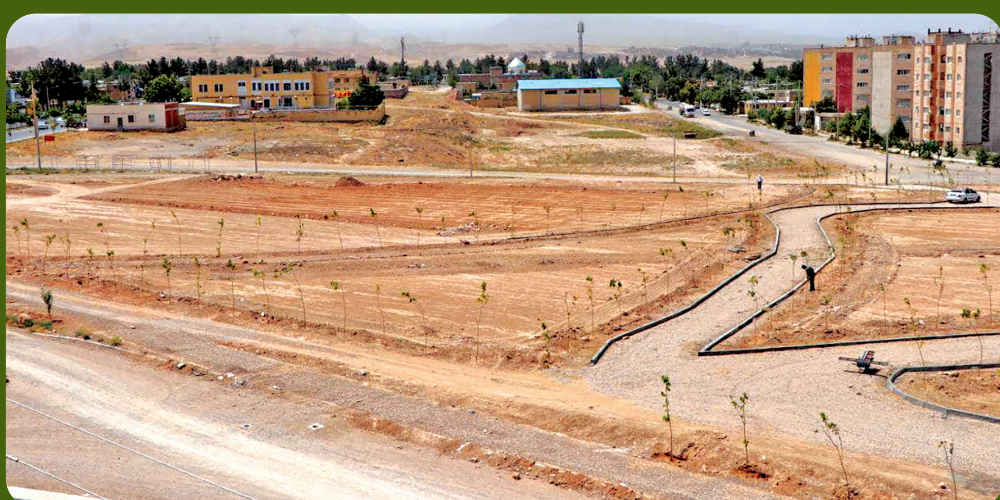
نمای کلی از طراحی و اجرای پارک هفت هکتاری شهرک ولی عصر