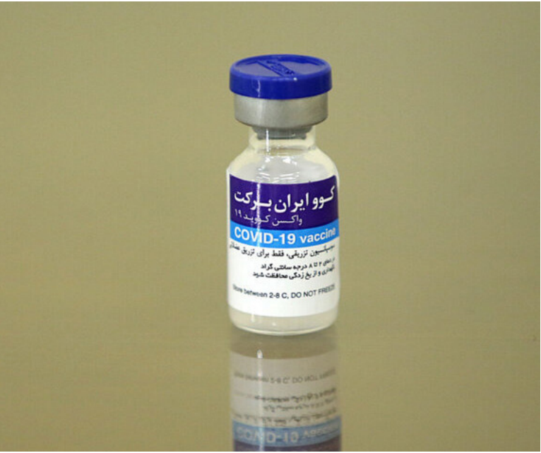
تصویربرداری از یک دوز COVID-19 واکسن ایران برکت