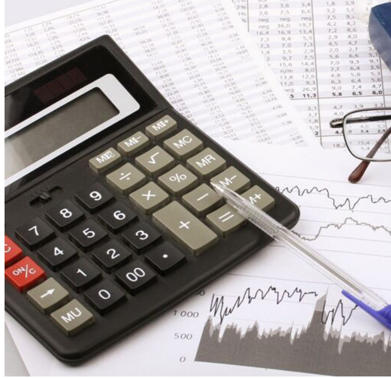
مدیرکل امور مالیاتی خراسان شمالی گفت: یکپهزار و ۹۱۰ میلیارد ریال مالیات مستقیم و غیرمستقیم (ارزش افزوده) در سه ماه نخست امسال از مردم این خطه در شمال شرق کشور وصول شد.

روزنامه صبح استان خراسان شمالی پست الکترونیک : Etefaghyeh@gmail.com