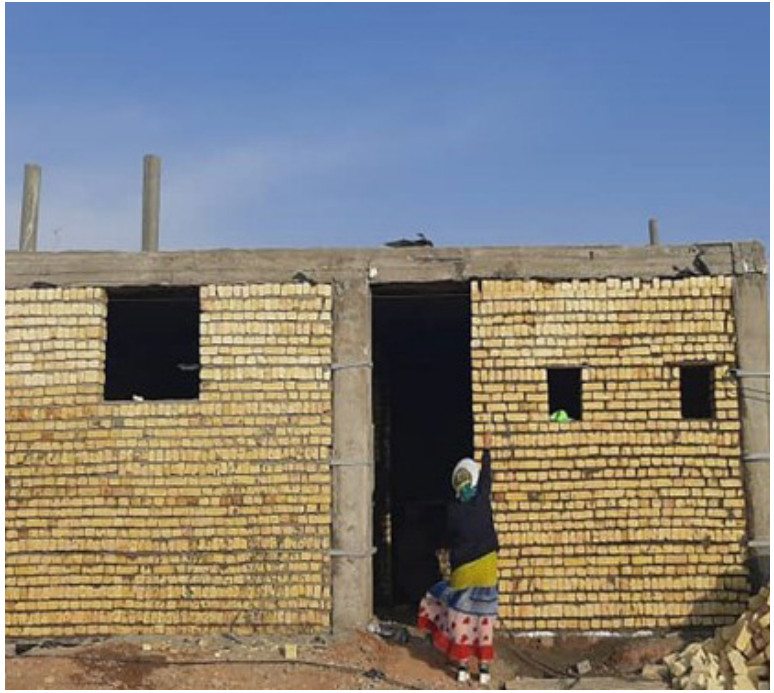
یک نفر از کارکنان کمیته امداد خراسان شمالی در حال بازدید از یک واحد مسکونی در روستای کلاهداری، کشمش، عسکری، لعل و یاقوتی، انگور سیاه و پیکامی است.

روزنامه صبح استان خراسان شمالی پست الکترونیک : Etefaghyeh@gmail.com