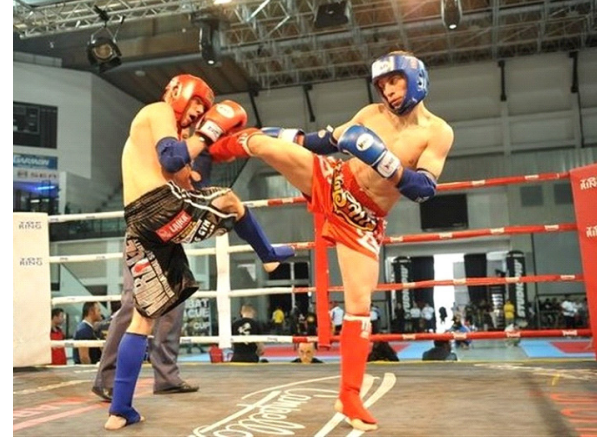
■ در حال حاضر وضعیت موی تای در خراسان شمالی چگونه است؟

با این دیدگاه که موی تای از رشته‌های ورزشی است که تاییدیه شورای فنی المپیک دارد و به زودی وارد المپیک خواهد شد و گذشت از گذشته این رشته ورزشی در استان که در دورانی مسکوت مانده بود از تیرماه سال جاری بود که با انتخاب بنده به عنوان رئیس انجمن موی تای خراسان شمالی بر آن شدیم روح تازه‌ای را در کالبد این ورزش دمیده و با حمایت رئیس هیات انجمن‌های ورزشی استان، اعضای کمیته‌ها را مشخص کرده و تیم منتخب استان را برای مسابقات انتخابی تیم ملی مشخص کنیم.