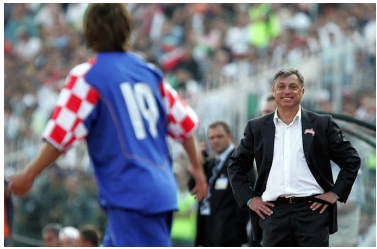
■ خبر تکار: به نظر شما تفاوت فوتبال در ایران و کرواسی چیست؟

اسکوچیچ: فوتبالست‌های ایرانی از نظر فردی و از نظر فیزیک بدنی در سطح بالایی قرار دارند. اما آنچه که فاقدها هستند و البته در حال پیشرفت‌اند، مسائل تاکتیکی است. آنها هنوز آفتد خوب نیستند اما وقتی به چشم انداز آینده نگاه می‌کنیم این چیزی است که خود را بالاتر ببرند. اروپایی‌ها همیشه از نظر تاکتیکی در سطح خوبی بودند و از آنجا که ایران بازیکنان زیادی در اروپا دارد، این موضوع به آرامی در حال تغییر است.