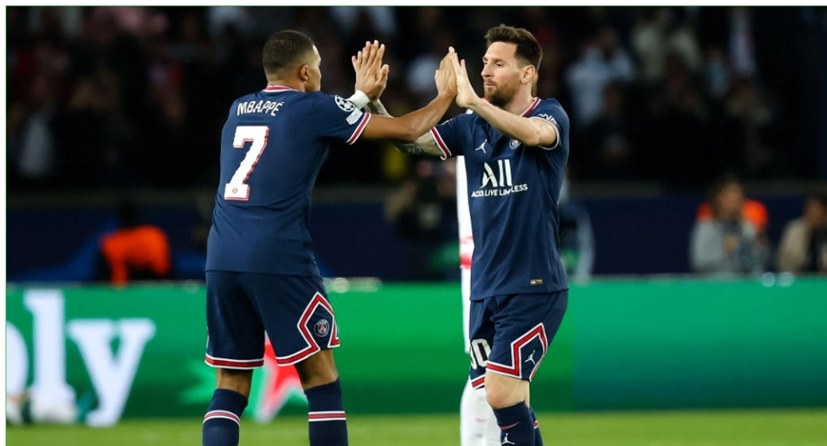
لیونل مسی، ستاره آرژانتینی پاری سن ژرمن بهترین شپ از زمان انتقال به این باشگاه را سپری کرد. فاصله زیادی تا پایان زمان رای گیری مراسم توپ طلای سال ۲۰۲۱ باقی نمانده و ستاره های بزرگ

هستند. گرچه امروز کوریره دلان اسپورت مدعی شد برنده توپ طلای امسال مشخص شده و این جایزه قطعا به لیونل مسی می رسد، اما او امشب در برابر لایپزیگ درخشان ظاهر شده تا نشان دهد یکی از ستاره های لایق برای دریافت این افتخار بزرگ است. لیونل مسی که پیش از این فقط در لیگ قهرمانان و برابر منچستر سیتی در لباس تیم جدید خود موفق به گلزنی شده بود، امشب نیز این روند را ادامه داده و دو بار دروازه لایپزیگ را باز کند. در اواسط نیمه دوم بود که پاس به بیرون کیلیان امپایه با ضربه این بازیکن همراه بود و دفع توپ گولاسچی به دیرک دروازه برخورد کرد تا در رباندن خود لیونل مسی به راحتی دروازه خالی را باز کند.