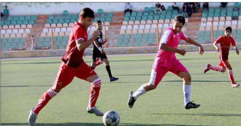
از مواقع برای شرکت در مسابقات از هزینه شخصی کارخانجات به عنوان حامی وارد میدان شوند تا شاهد خود استفاده می کنند که انتظار می رود صنایع و افتخارات بیشتری برای ورزشکاران شهرستان باشیم.