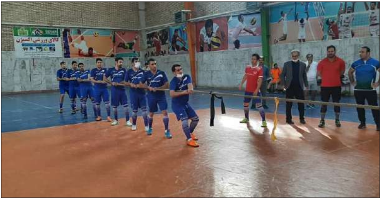
کشش از ۳ کشش و در جدول گروهی بود که تیم امتیاز،باخت یک بر دو ۱ امتیاز و باخت صفر بر ۲ ها با برد ۲ بر صفر ۳ امتیاز،برد ۲ بر یک ۲ بدون کسب امتیاز ،امتیاز دهی می شدند.

رقابت های طناب کشی آقایان ویژه کارکنان دولت در حالی پایان یافت که تیم اداره کل امور مالیاتی با ۹ امتیاز قهرمان این مسابقات شد.