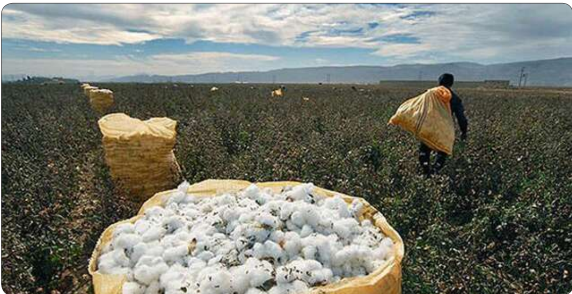
شمالی یادآور شد: با وجود اطلاع رسانی های بسیار به پنبه کاران مبنی بر اینکه محصول پنبه خود را در کیسه های غیر پلاستیکی جمع آوری کنند، با مدیر امور زراعت سازمان جهاد کشاورزی خراسان

مدیر امور زراعت سازمان جهاد کشاورزی خراسان شمالی با اعلام اینکه امسال محصول پنبه در سطح ۹ هزار هکتار از مزارع استان کشت شد، گفت: از این سطح ۲۷ هزار تن وش پنبه برداشت شد.