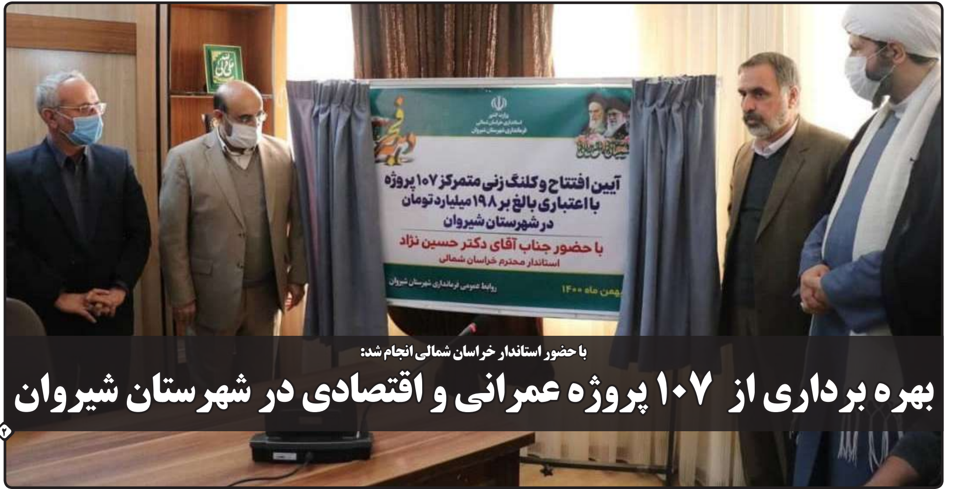
با حضور استاندار خراسان شمالی انجام شد:

بوی نامطبوع آب آشامیدنی و شلوغی چشمه های اطراف بجنورد