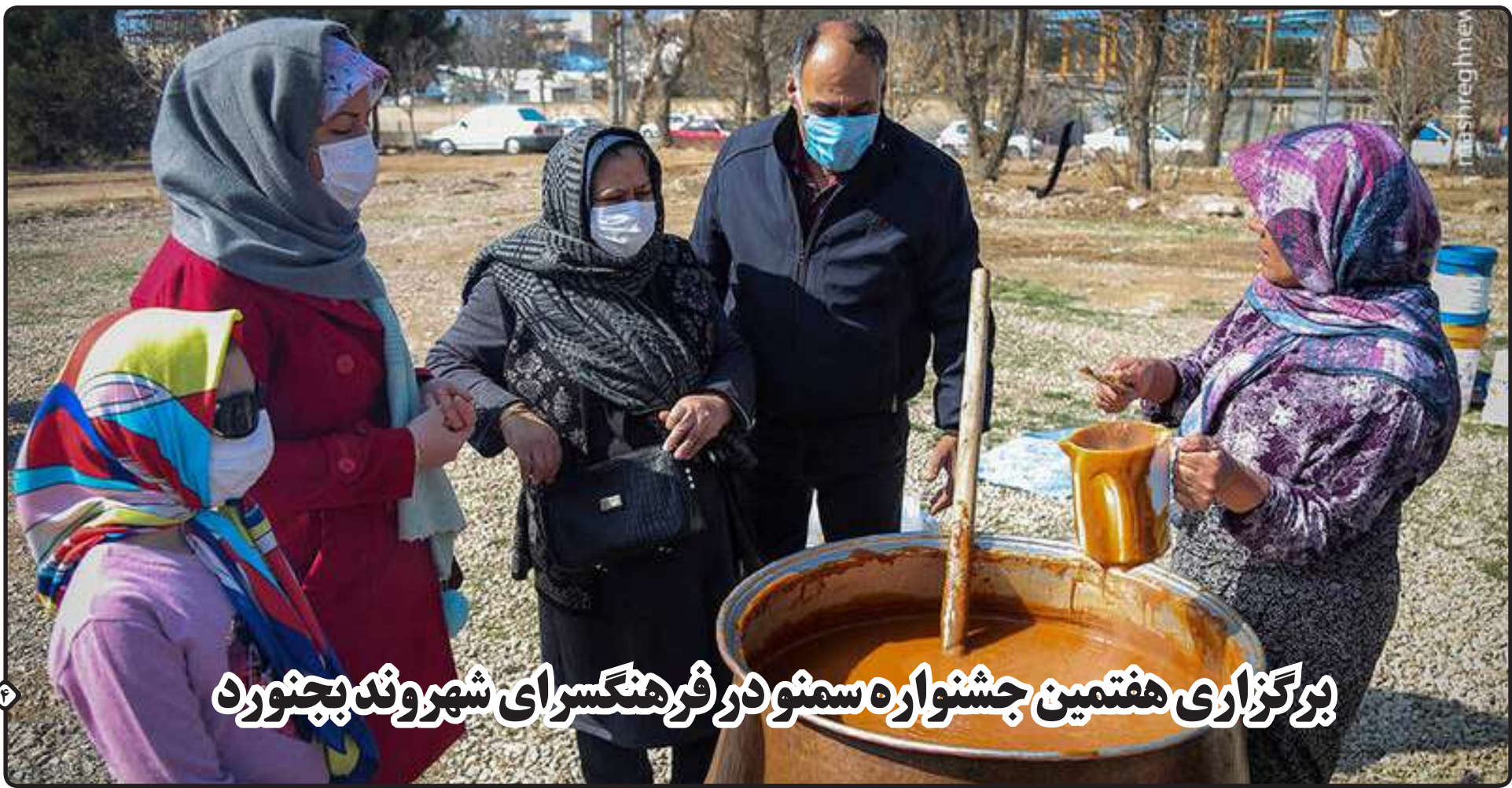
برگزاری هفتمین جشنواره سمنو در فرهنگسرای شهروند جاجرمد