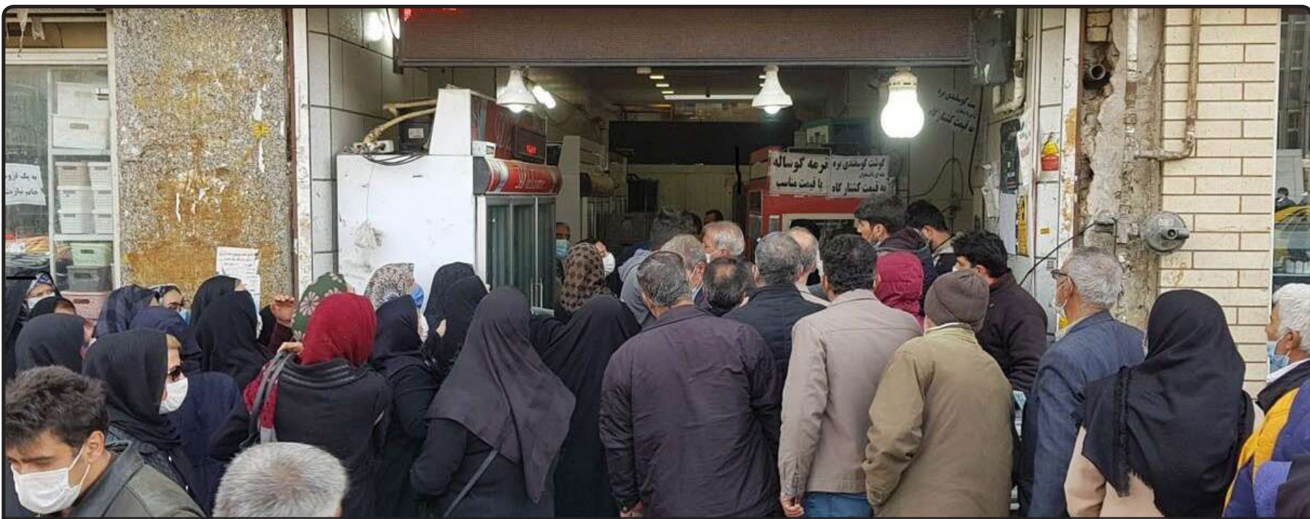
کوینی شدن اقتصاد در شرایط عادی