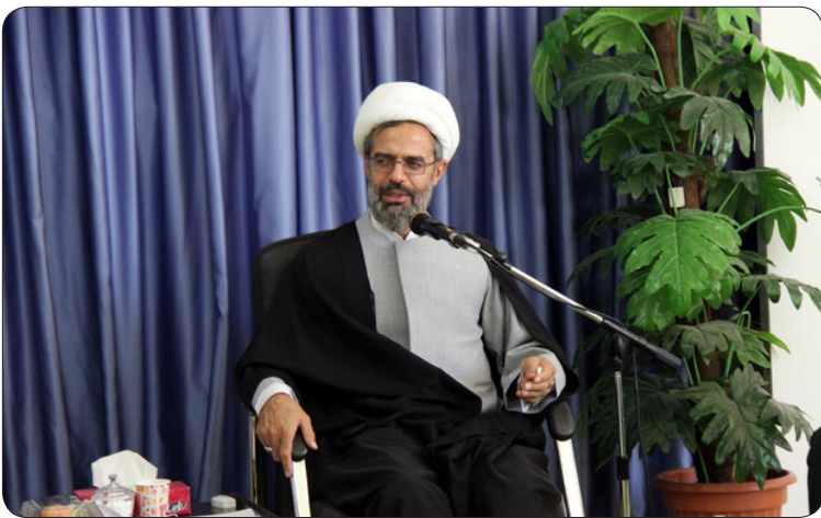
استاندار خراسان شمالی: