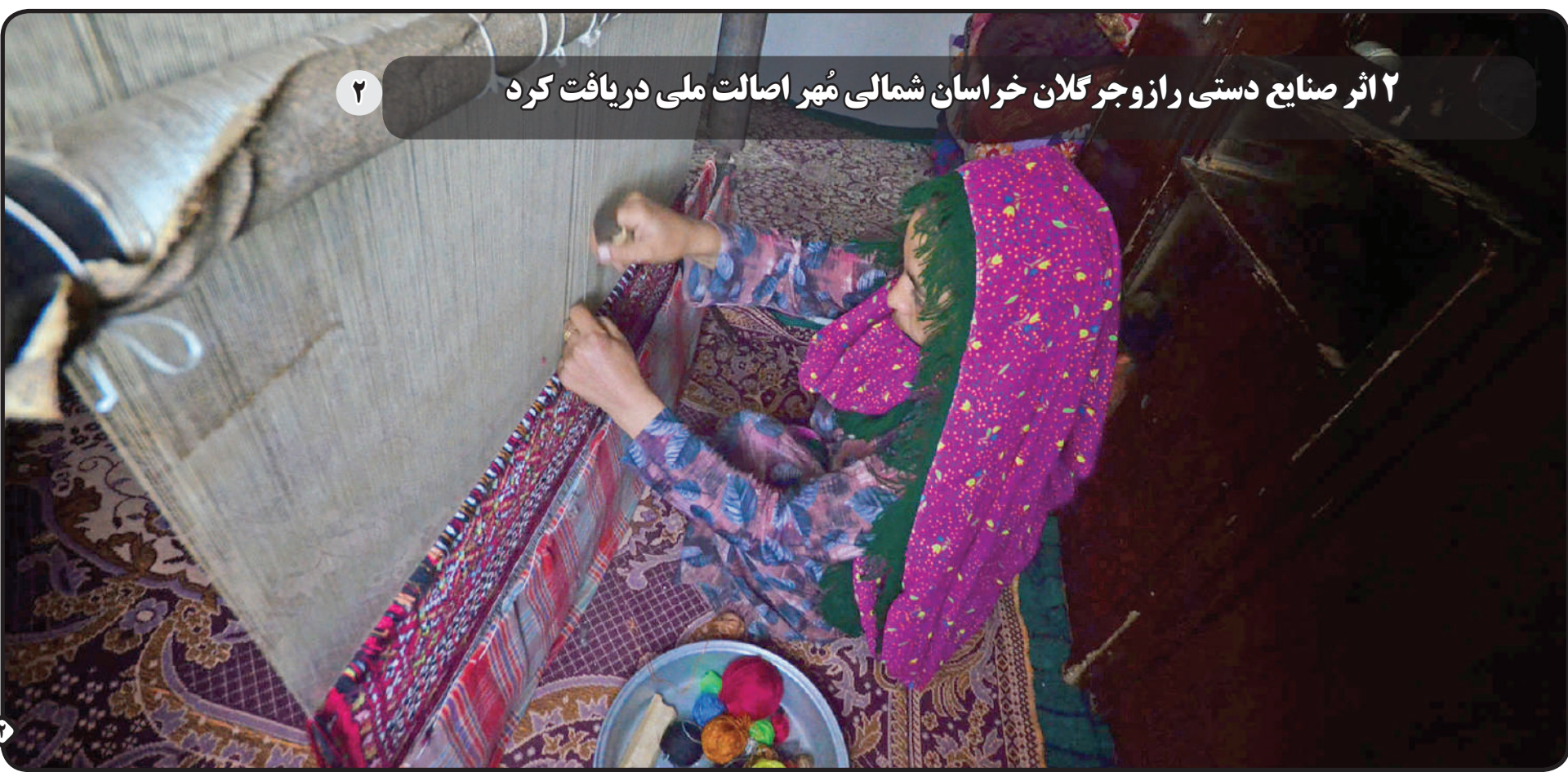
۲ اثر صنایع دستی رازوگر کلان خراسان شمالی مهر اصالت ملی دریافت کرد