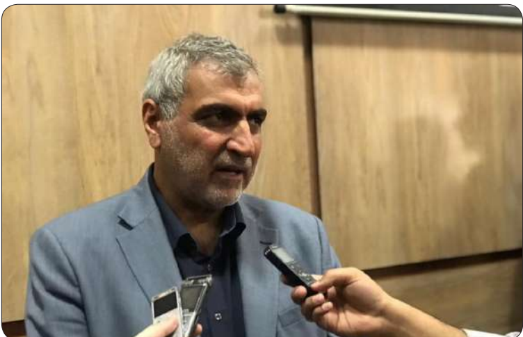
اعتباری افزون بر ۱۳۹ میلیارد و ۵۰۰ میلیون تومان اجرای برنامه اشتغال گسترده و مولد با تأکید بر دریافت کرده اند.

معاون حقوقی و امور مجلس وزیر امور اقتصادی و دارایی گفت: برای تکمیل هزار و ۳۲۰ طرح نیمه تمام خراسان شمالی ۲ هزار میلیارد تومان از محل بند الف تبصره ۱۸ بودجه اختصاص می یابد. هادی قوامی در حاشیه برگزاری میز خدمت اداره کل اقتصاد و دارایی خراسان شمالی، در آستانه سفر استانی هیات دولت به این استان، در گفت و گو با خبرنگاران اظهار داشت: منابع تبصره ۱۸ از محل هدمندی یارانه ها تامین می شود که انتظار می رود در صورت تحقق، رشد مناسبی را در عرصه صنعت و نیز اشتغالزایی خراسان شمالی ایجاد کند. وی تصریح کرد: در مجموع هزار و ۲۲۰ طرح نیمه تمام در استان خراسان شمالی برای دریافت ۲ هزار میلیارد تومان اعتبار از محل تسهیلات تبصره ۱۸ مصوب و به بانک های عامل معرفی شدند. به گفته معاون حقوقی و امور مجلس وزیر امور اقتصادی و دارایی؛ از این تعداد تاکنون ۱۷۱ طرح