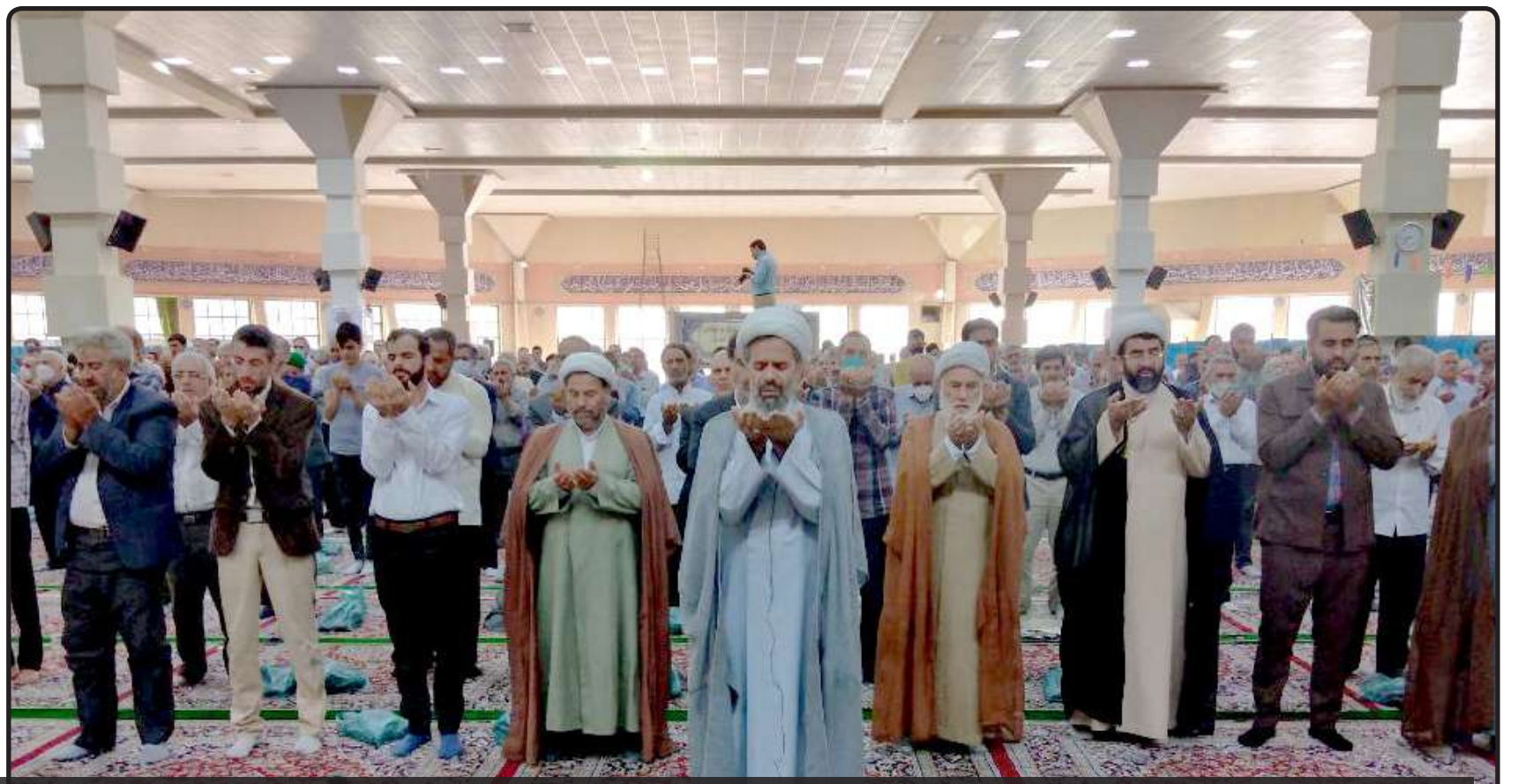
اقامه نماز عید سعید قربان، مراسم دعای روز عرفه در سراسر خراسان شمالی برگزار شد