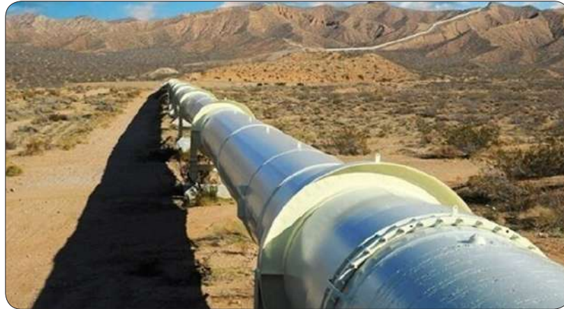
تامین فرآورده های نفتی خراسان شمالی به صورت