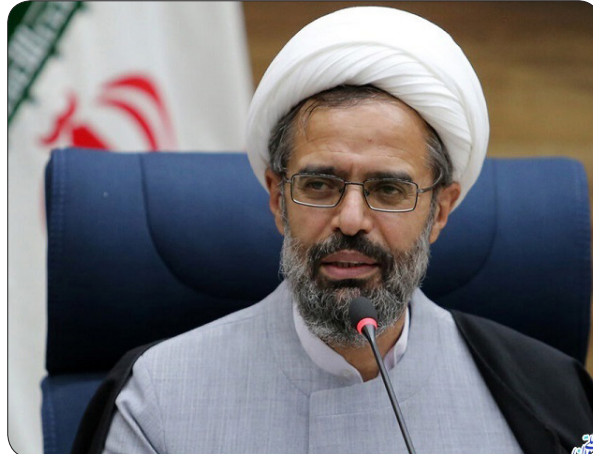
اعتلای کشور شد.

بوده است. نماینده ولی فقیه در خراسان شمالی با بیان اینکه خدا را شاکریم که رهبری فرزانه و حکیم داریم، افزود: مردم قدردان این رهبر هستند، رهبری که تمام دشمنان برای مقابله با ایشان اتاق های فکری به راه انداخته اند، توطئه های