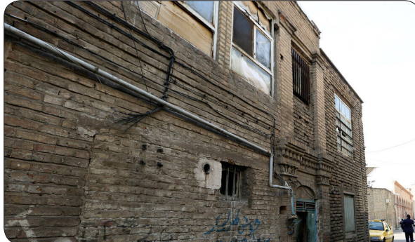
مدیرکل راه و شهرسازی خراسان شمالی، نبود همکاری مناسب از طرف دستگاه می رود و تخصیص قطره چکانی اعتبارات از مشکلات این بخش محسوب می شود. مدیرکل راه و شهرسازی خراسان شمالی، نبود همکاری مناسب از طرف دستگاه

مدیرکل راه شهرسازی خراسان شمالی گفت: تکمیل طرح های بازآفرینی شهری در سه شهر بجنورد، شیروان و اسفراین ۲۰ میلیارد تومان اعتبار نیاز دارد.