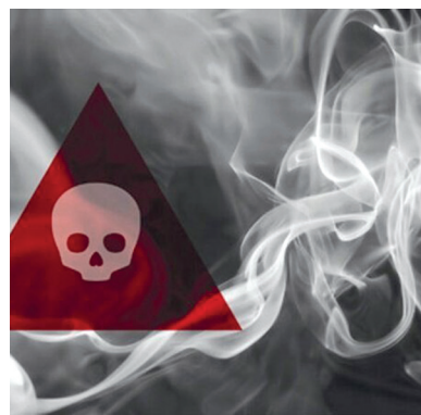
دست می‌دهند. استفاده نکردن از موتور برق در محیط بسته معاون امداد و نجات جمعیت هلال احمر خراسان شمالی به نکات ایمنی هنگام استفاده از موتور برق اشاره کرد و

وی همچنین تأکید کرد: این دستگاه همانند سایر تجهیزات برقی نباید در معرض آب و خیس شدن قرار بگیرد. به همین دلیل توصیه می‌شود که آن را زیر آلاچیق یا سایبان نگه داری کرده و یا از عایق‌های پوششی برای محافظت از آن در هوای بارانی و یا سایر شرایطی که ممکن است موجب خیس شدن دستگاه شود، استفاده شود. علاوه بر این باید پیش از روشن کردن دستگاه از خشک بودن آن اطمینان حاصل کرد.