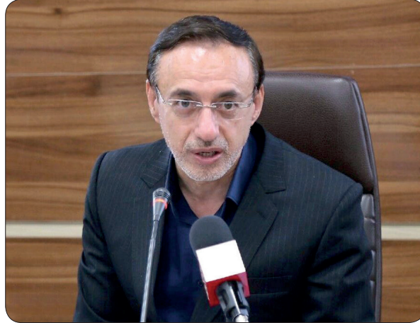
شایستگی وجود ندارد اضافه کرد: گاهی اتفاقاتی می‌افتد که به وزیر تعاون کار و رفاه اجتماعی گزارشات را ارائه داده ام، در این دولت نباید گاهی افراد شایسته حذف شده و افراد ناشایسته‌ای بر سر کار بیایند.

نماینده مردم پنج شهرستان خراسان شمالی بیان داشت: تعلیم و تربیت در سطوح مختلف کشور و توجه به معلم، استاد، دانشگاه و مدرسه بسیاری از مشکلات امروز کشور را مرتفع خواهد کرد زیرا مشکلات کنونی ناشی از گذشته است. وی با اشاره به اینکه عدالت در پرداخت باید رعایت شود، گفت: نیروهای چندانکه با پرداخت‌های متفاوت در دستگاه‌ها تا چه زمانی باید بلا تکلیف بمانند؛ قرار دادن نظام شایستگی در انتصابات یک طراحی عملیاتی نیاز دارد، این مهم بسیاری از گره‌های کشور را رفع خواهد کرد.