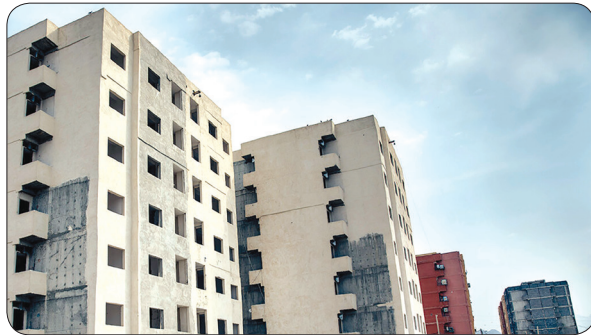
بهره برداری از واحدهای طرح ارمغان پس از یک دهه انتظار

موافقت نکرد البته بانک اعلام کرد که برای ادامه پرداخت تسهیلات، باید سند یکپارچه ارائه شود این در حالی بود که سند زمین فاز اول پروژه مالکان متعدد داشت. به طوری که شهرداری، اوقاف، شرکت عمران و بهسازی، سازمان ملی زمین و مسکن، اشخاص حقیقی، مالکان زمین هشت هزار متری فاز اول پروژه بودند که به نوعی معارض محسوب شدند.