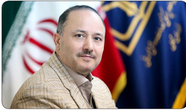
دست یافته ایم.

سرپرست دانشگاه علوم پزشکی خراسان شمالی تصریح کرد: حرکت عظیمی به جهت ایجاد زیرساخت‌های درمانی با تکنولوژی بالا در حال انجام است و در این راستا دستگاه‌های پیشرفته‌ای از جمله شتاب‌دهنده خطی، ام‌آرآی با اعتبار میلیاردی به‌زودی به استان وارد می‌شوند. وی با اشاره به ساخت بیمارستان ۳۲۰ تختخوابی مادر و کودک، گفت: جوانی جمعیت شعار ما است و باید برای تحقق آن زیرساخت‌های لازم فراهم شود. شاهین فر خاطر نشان کرد: کسانی که