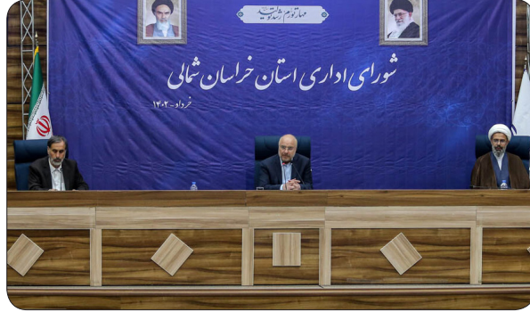
قانون بیمه ساختمانی اشکالاتی دارد و باید به سرعت اصلاح شود

وی تاکید کرد: همه ما باید یک هدف داشته باشیم بنابراین اولین درخواستی که دارم این است که هر کاری که می خواهیم انجام دهیم هماهنگی و هم جبهی به سوی مسیر داشته باشیم و این مهمترین موضوع است.