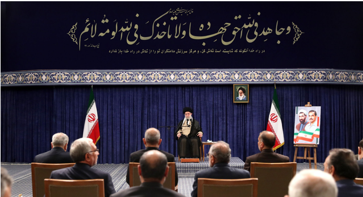
در راه خدا، اکنون که شایسته است تقاضای من و هر کس سرزنش نامتقربان را از تقاضای در راه خدا بپا ندارد

رهبر معظم انقلاب اسلامی در دیدار رئیس جمهور و اعضای هیئت دولت مطرح کردند؛