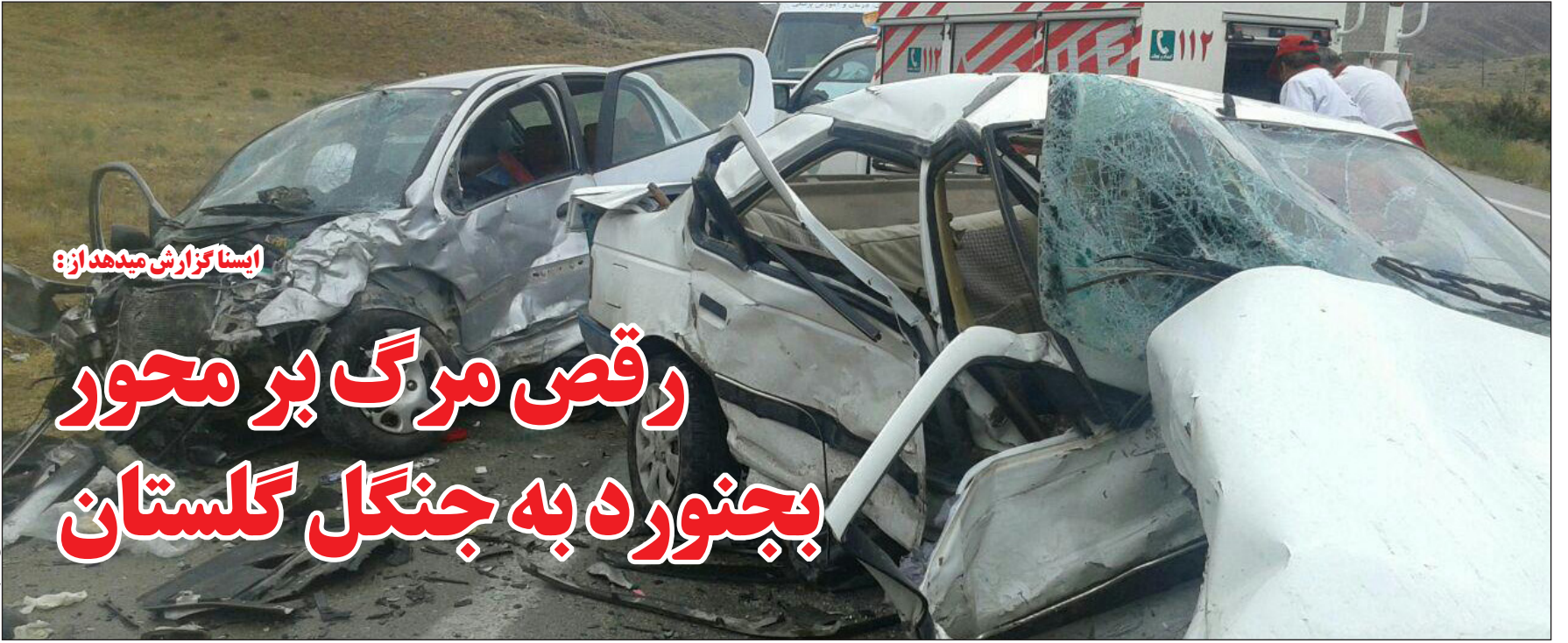
ایستادگزارش میدهد از: