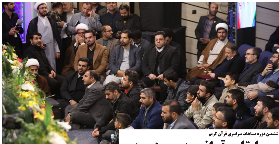
با استقبال پرشور مردم خراسان شمالی از چهل و ششمین دوره مسابقات سراسری قرآن کریم

اخبار رئیس مرکز قرآن و عترت وزارت نیرو عنوان کرد؛ شهروندان خراسان شمالی مایه افتخار کشور هستند فروش محصولات تولیدی شهرداری شیروان، به استان های دیگر در دستور کار قرار گرفت پرداخت تمامی مانده مطالبات کلزا کاران خراسان شمالی ۷۰ کلاه صندوق خسارت بیمه بر سر موتورسواران خراسان شمالی