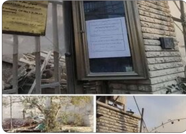
به خداوند و کمک‌های جبهه مقاومت در مقابل این ظالمان جهانی به خوبی ایستاده‌اند. اسرئیل و آمریکا بدانند که با شهادت رساندن برادران ما در سوریه، همچنان مصمم‌تر در گرفتن انتقام از آنها خواهیم

نتانیاهو و بایدن به خوبی متوجه شده‌اند که اهداف شیطان‌ی آنها در سوریه و دیگر کشورهای منطقه با شکست روبه‌رو شده است به گونه‌ای که با وجود محاصره مردم مظلوم فلسطین در ارسال کمک‌های دارویی و غذا، برادران ما در غزه با توکل