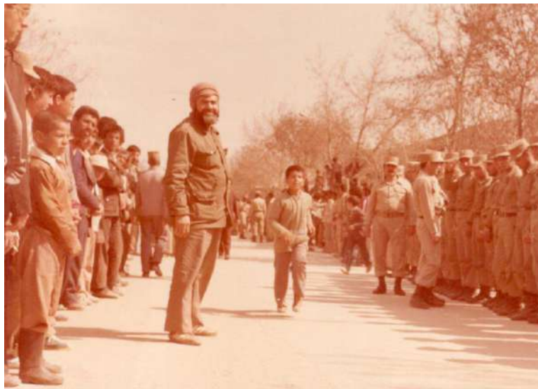
استقبال از آزادگان