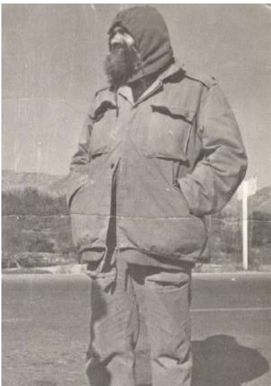
استقبال از آزادگان

نصب ضریح امام زاده و ساخت سردخانه و غسلخانه بهداشتی و دیوار کشی اسکان و پذیرایی از دو هزار آواره جنگی و ایجاد تسهیلات در جهت اداره اسرای عراقی در پادگان بجنورد از موسسین و هیات امنای پروژه های مردمی فرودگاه شهرستان بجنورد و دانشگاه آزاد و پیام نور و همچنین دانشکده پرستاری و تربیت معلم خواهران و ... یاری رساندن به زلزله زدگان طبرس و رودبار و بیم و سیل زدگان قوچان و اسکان و پذیرایی از زلزله زدگان روستاهای بجنورد با همیاری مردم از موسسین بانک خون و طرح توسعه شمال خراسان و دهها موسسه غیرانتفاعی کمک به آزادی زندانیان و همچنین نجات چنده ده زندانی اعدای از چوبه دار و کمک به ورشکستگان مالی و ... ساخت دهها مدرسه و کودکستان از جمله مهد کودک فرشتگان و معلم و مدرسه تیزهوشان و مدرسه کودکان استثنایی صبوره ... ساخت دهها مسجد و حسینیه در جهت خدمت به زائران و عاشقان حسینی و ساخت ادارات و مراکز فرهنگی از جمله اداره بازرگانی و راهنمایی رانندگی و ... تهیه و هدیه صدها جهیزیه برای زوج های جوان با کمک های مردمی و صدها و دهها طرح و خدمات شایسته دیگر با همیاری مردمی معتمد و امین مردم و منتخب اول مردم در دو دوره شوراهای اسلامی شهر بود که بارزترین ویژگی اش با توجه به مسئولیت فراوان ساده زیستی، صداقت و مردم دار بودن ایشان است.