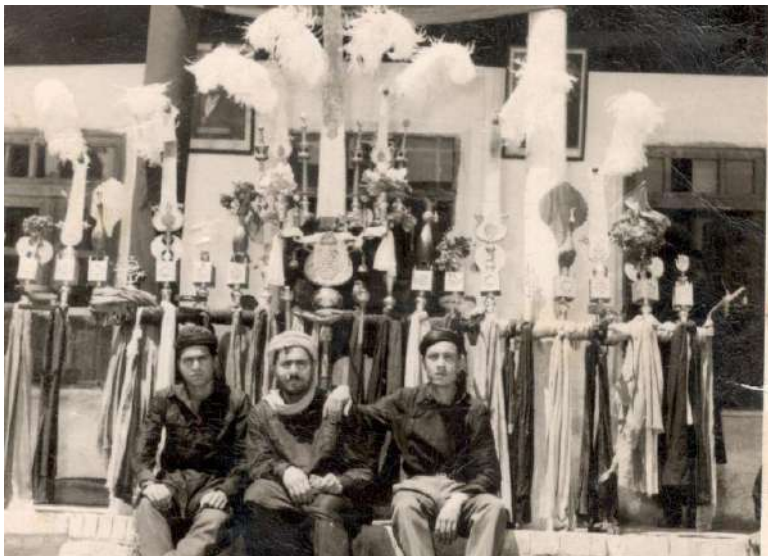
سال ۱۳۴۳ حسینیه حریری