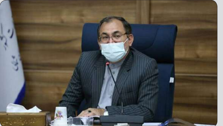
بجنورد عمران روستایی و توسعه مناطق کم برخوردار است. بجنورد عمرانی ۱ درصد و در بخش تملک دارایی ۲ درصد است.

وی بیان داشت: باید تلاش شود پروژه‌های ملی استان خراسان شمالی به ویژه در بخش آب با هدف حل مشکل کم آبی افزایش یابد.