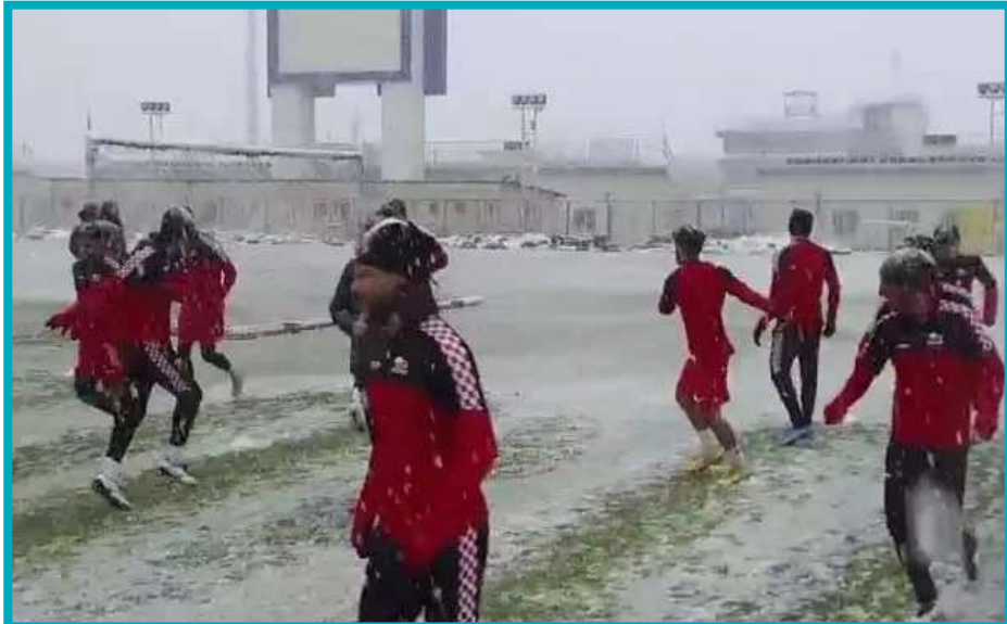
پروژه تحویل یا تخریب؟

حضور عده‌ای از هواداران معترض در مقابل ساختمان باشگاه تراکتور تبریز