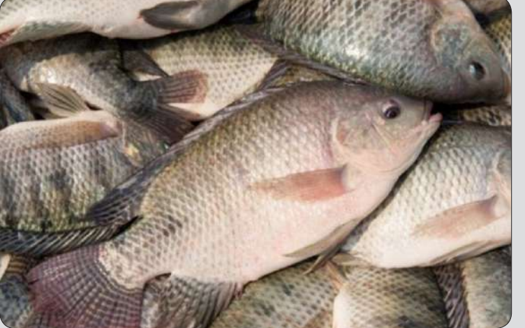
پرورش ماهی تیلاپیا

وی گفت: ماهی تیلاپیا در سـرپایط دمایی زیر ۱۲ درجه سانتی گراد زنده نمی‌ماند، در فصل زمستان