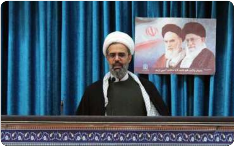
نماینده ولی فقیه در خراسان شمالی در جریان سفر به مشهد مقدس

نوری با تأکید براینکه حفظ اقتدار در مذاکره بسیار اهمیت دارد، بیان کرد: امروز تیم مذاکره کننده به لغو تحریم‌ها تأکید می‌کند و اگر طرف مقابل تحریم‌ها را لغو نکند نباید انتظار انجام تمهات را از ایران داشته باشد.