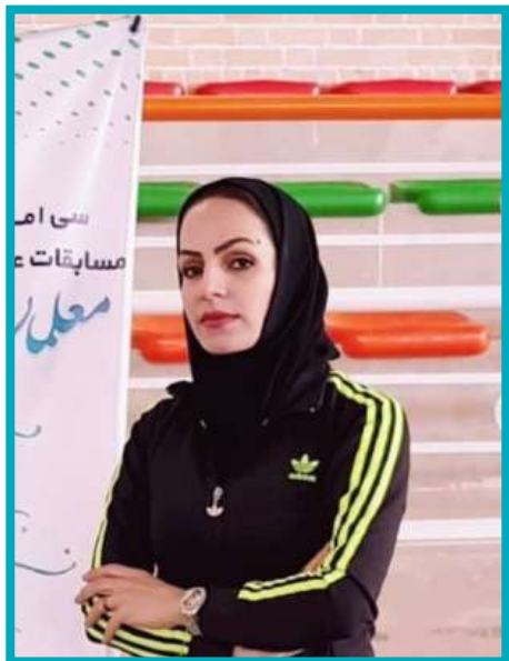
قابل قبولی است. همچنین تا پیش از کرونا در داخل استان شاهد میزبانی بازی های دوستانه و تدارکاتی خوبی با استان های همجوار بودیم که خود آمادگی لازم را برای حضور در هر عرصه ای از مسابقات را فراهم می کرد و محکی بود برای سنجش سطح بازیکنان و اکنون با کم رنگ شدن این بیماری نیاز به برنامه ریزی های مجدد در این زمینه را داریم.