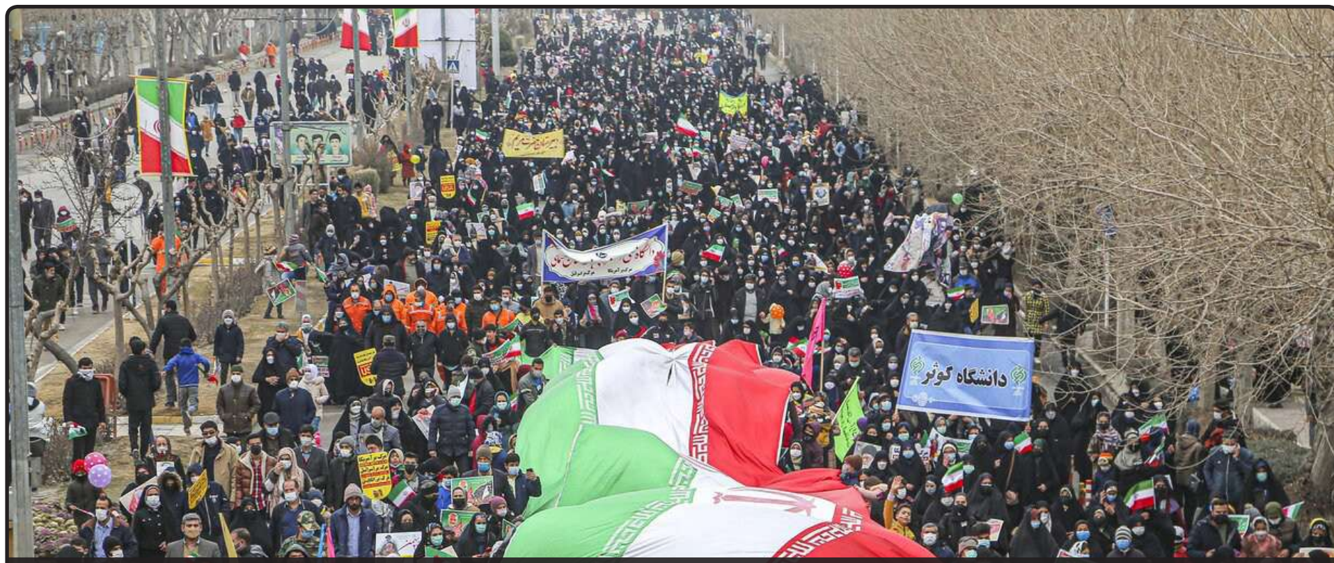
نماینده ولی فقیه و ریاست سازمان عقیدتی سیاسی وزارت دفاع

ریس اتاق بازرگانی ایران مطرح کرد راه خروج اقتصاد ایران از اوضاع بحرانی