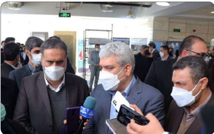
همه رفع مشکلات فرهنگی به وسیله آن ها، موضوعی است که استان بیش از هرچیزی به آن نیاز دارد و این اتفاق در حال انجام شدن

است. معاون علمی و فناوری رئیس جمهور در ارتباط با حمایت های صورت گرفته از شرکت های