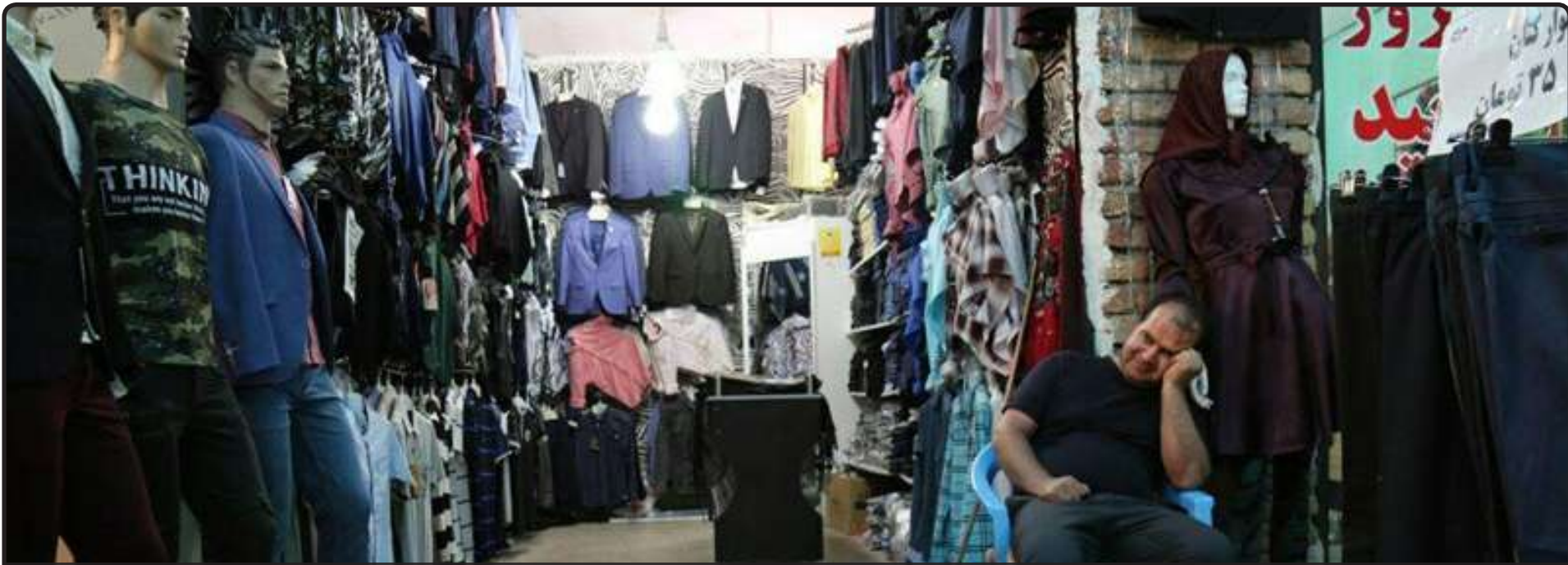
تزاری شی از وضعیت بازار پوشاک در روزهای پایانی سال؛