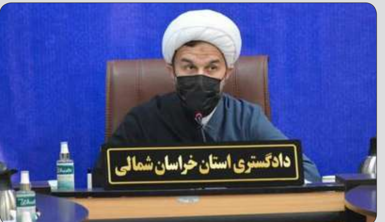
شاخص‌های مربوط به کاهش جمعیت کیفری زندان‌ها همواره در ردیف استان‌های ممتاز