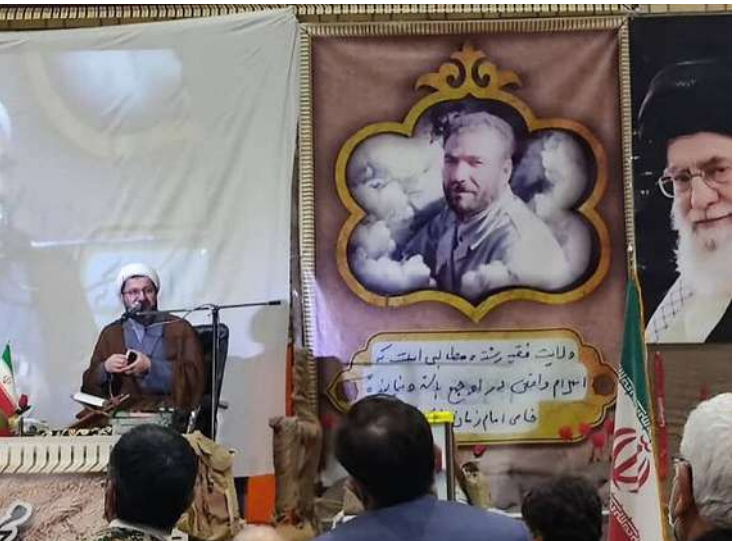
عده های خدا جلو رفتند؛ ما نیز ثمرات حقیقی این وعده ها را در تنگنای مختلف نظام دیدیم. وی گفت: اگر هر انقلابی به اندازه انقلاب ما با برای وارونه جلوه دادن انقلاب و ولایت فقیه است. وی افزود: شهدا می دانستند اگر پشت ولایت را خالی کنند چه اتفاقی می افتد و درس آنان برای ما خالی نکردن پشت امام و حرکت در مسیر ولایت است.

رئیس موسسه روایت سیره شهدا گفت: وظیفه امروز همه ما سرباز بودن در عرصه عمل بر ۴ اصل گام دوم انقلاب است تا همچون شهدا طعم وعده های خداوند را بچشیم.