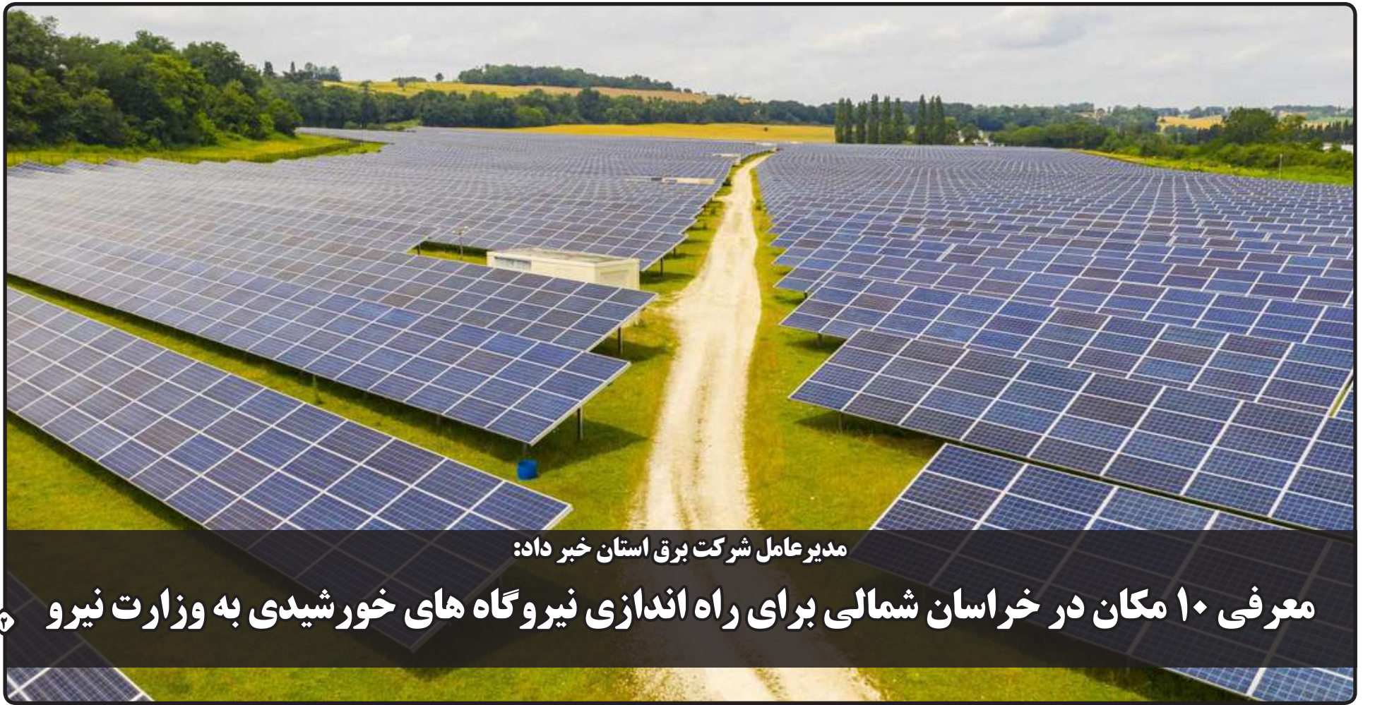
مدیرعامل شرکت برق استان خبر داد: