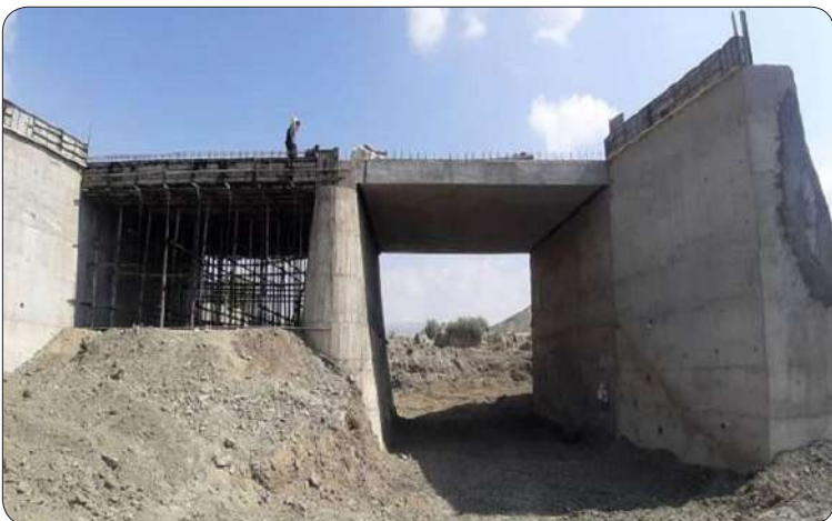
خرابی پل‌ها (رد) و در صورت نیاز اقدامات لازم برای مرمت، بازسازی و اولویت بندی انجام می‌شود که در همین راستا تاکنون مشخحات ۶ هزار و ۴۰۰ دستگاه انواع آبرو و پل در این سامانه ثبت شده است.

ادامه داد: مرمت و بازسازی، لایروبی و تنقیه پل‌ها به خصوص در فصل بارش، مانع آسناد مسیره‌های ارتباطی می‌شود و زمینه تردد روان در جاده‌ها را فراهم می‌کند. به گزارش اتفاقیه به نقل از روابط عمومی اداره کل حمل و نقل جاده‌ای خراسان شمالی، شهامت همچنین درباره پل‌های در حال احداث اداره کل راهداری و حمل و نقل جاده‌ای استان در سال جاری تصریح کرد: از ابتدای سال گذشته تاکنون ۱۵ دستگاه پل در محورهای استان به بهره‌برداری رسیده و ۸ دستگاه پل دیگر نیز در محورهای استان در حال ساخت است که در شهرستان مانه و سملقان ۳ دستگاه پل در محور خرتوت - میوق و یک دستگاه پل در محور حصه گاه، در شهرستان راز و جرجان یک دستگاه پل در غلامان و یک دستگاه پل در کیلو پنجه و در شهرستان بجنورد یک دستگاه پل در محور اخلی دنگل و یک دستگاه پل در محور آقایی در صورت تخصیص اعتبار مورد نیاز طی سال جاری به بهره‌برداری خواهد رسید.