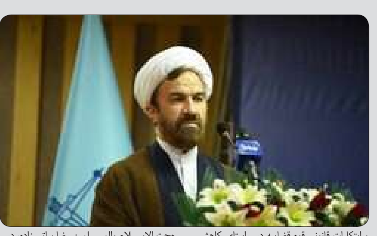
رئیس کل دادگستری خراسان شمالی در رشد ۲ درصدی موارد اعمال مجازات‌های جایگزین حبس در ۳ ماهه نخست سال جاری خبر داد. به گزارش اتفاقیه به نقل از روابط عمومی دادگستری خراسان شمالی، حجت الاسلام و المسلمین رضا براتی زاده، گفت: گاهی اوقات، اعمال مجازات‌های جایگزین حبس به ویژه در مواردی که افراد از مهارت و هنر و یا توانمندی‌ها و قابلیت‌های ویژه‌ای بهره‌مند هستند، می‌تواند به نفع جامعه باشد. وی با تأکید بر استفاده بیشتر از مجازات‌های جایگزین حبس، تصریح کرد: همواره به مدیران قضایی و قضات رسیدگی‌کننده مؤکداً توصیه شده به جای اینکه در نتیجه تصمیمات قضایی برخی از محکومین به زندان بروند و متعاقباً منتظر استفاده از تأسیسات قانونی از قبیل عفو و آزادی مشروط باشند، بهتر است با صدور آراء متناسب، تمهیداتی فراهم شود تا افراد واجد شرایط، از ابتدا یا در اثنای تحمل محکومیت، مشمول مجازات جایگزین حبس شوند و بدین ترتیب توانمندی‌های آنان در مسیر خدمات عام‌المنفعه بکار گرفته شود. مقام عالی قضایی استان با اشاره به ظرفیت‌ها

حجت الاسلام والمسلمین رضا براتی زاده، در جمعیت کیفری زندان‌ها گفت: با توجه به اینکه ارتکاب جرم نظم و آرامش اجتماعی را تحت تأثیر قرار می‌دهد لذا قوه قضاییه در صورت استعدای محسوس کردن برخی محکومین، از طریق راهکارهای جایگزین، از توانمندی‌های آنان در جهت ارائه خدمات اجتماعی و عام‌المنفعه استفاده نماید. وی در بیان اینکه در ۳ ماهه ابتدای سال گذشته از مجموع شش هزار و ۳۴۱ فقره دادنامه دارای محکومیت کیفری، در ۸۵۹ فقره، مجازات جایگزین حبس استفاده شده؛ تصریح کرد: طی ۳ ماهه ابتدای سال جاری، در ۱۶ درصد و در مدت زمان مشابه سال گذشته در ۱۴ درصد مجموع دادنامه‌های دارای محکومیت‌های کیفری، مجازات‌های جایگزین حبس اعمال شده است. مجازات‌های جایگزین حبس در بیان جزئیات این آمار خاطر نشان کرد: جزای نقدی با ۹۱۴ مورد و خدمات عمومی رایگان با ۱۲۵ مورد، بیشترین مصادیق اعمال مجازات‌های جایگزین حبس طی ۳ ماهه سال جاری به شمار می‌رود. رئیس کل دادگستری استان در پایان به مدیران قضایی به ویژه دادستان‌ها و دایران ناظر زندان و نیز رؤسای زندان‌ها توصیه کرد: در مواردی که اعمال مجازات‌های جایگزین حبس به علت وجود موانع قانونی امکان‌پذیر نیست، ترتیبی اتخاذ شود تا افراد واجد شرایط قانونی بتوانند ادامه دوران محکومیت خود را از طریق باند الکترونیک در خارج از زندان سپری کنند.