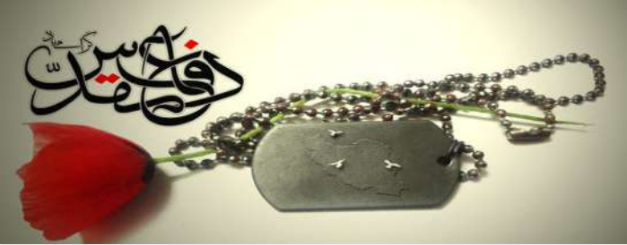
درباره هفته دفاع مقدس