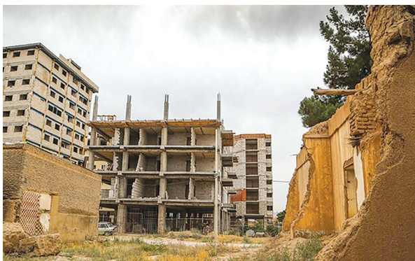
شهر باشیم. از سوی شهرداری به سازندگان و مالکان هسته مرکزی شهر اهدا می شود.

خواهد شد، گفت: این بسته ها شامل مشوق های مختلف شهرسازی است و پیش بینی می شود با استقبال سازندگان و مالکان بافت فرسوده در مرکز شهر مواجه شود. شهردار بجنورد اظهار کرد: در تلاش هستیم تا ضوابطی از جمله تراکم تشویقی، سطح اشغال بیشتر، تسهیلات در زمینه پارکینگ و برخی جزئیات دیگر در این بسته های تشویقی گنجانده شود تا جذابیت ساخت و ساز را در بافت فرسوده هسته مرکزی شهر برای سازندگان و مالکان افزایش دهیم.