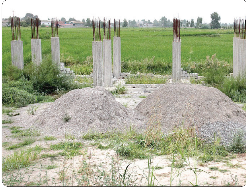
شهرداری ها متقاضی تغییر کاربری فضاهای سبز مناطق شهری استان

معاون شهرسازی و معماری اداره کل راه و شهرسازی خراسان شمالی خاطر نشان کرد: الحاق زمین به محدوده و حریم شهرهای بجنورد و شیروان که بالای ۵۰ هزار نفر جمعیت دارند نیازمند اخذ مصوبه از شورای عالی شهرسازی کشور هستند که اقدام برای اخذ این مصوبه در دست اجرا قرار گرفته است.