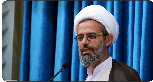
رسالت و مسوولیت مهم جامعه بر عهده خبرنگاران است

نماینده ولی فقیه در خراسان شمالی در ادامه سخنانش با گرامیداشت ۱۷ مردادماه سالروز شهادت محمود صامی خبرنگار خبرگزاری جمهوری اسلامی و روز خبرنگار گفت: خبرنگاران رسالت و مسوولیت مهم جامعه را برعهده دارند. حجت الاسلام و المسلمین نوری اظهار کرد: هفدهم مرداد ماه در حقیقت روزی برای گرامیداشت تلاش های شجاعانه و صادقانه خبرنگارانی است که برای