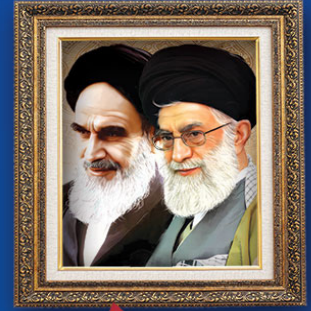
امام خامنه ای مدظله العالی : دهه فجر در حقیقت ولادت امامت در این کشور است؛