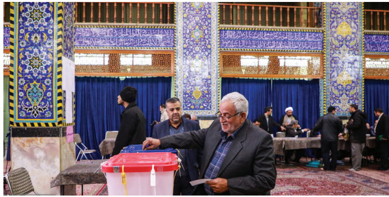
رقابت نامزدها، گواه این حضور خالصانه و بی منت است، تصریح کرد: جامعه رسانه‌ای استان در این انتخابات به وظیفه و تکلیف شرعی و

مدیرعامل خانه مطبوعات و رسانه‌های خراسان شمالی گفت: مدیران و خبرنگاران رسانه‌های این استان به عنوان سربازان خط مقدم جبهه فرهنگی و پیشگامان عرصه انتخابات در کنار سایر مدیران نهادها و دستگاه‌های مسئول در صف مقدم انتخابات دوازدهمین دوره مجلس شورای اسلامی و ششمین دوره مجلس خبرگان رهبری در اطلاع رسانی به هنگام و تبیین شرایط کشور و اقناع افکار عمومی برای مشارکت حداکثری مردم در انتخابات سنگ تمام گذاشته و در ایفای رسالت خطیر خود نقش آفرینی کردند.