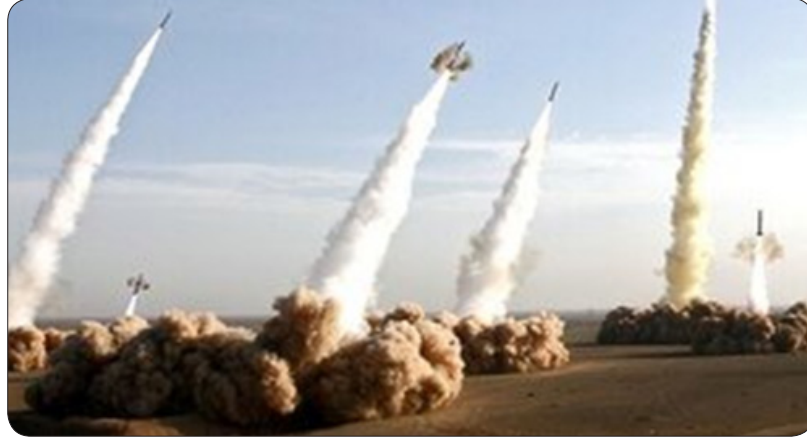
ژیر خطر به صدا در آمد

تارنمای خبری روزنامه ژاپن تایمز در واکنش به پاسخ گسترده موشکی و پهپادی جمهوری اسلامی ایران به اقدامات تجاوزگرانه رژیم صهیونیستی نوشت: ایران در پاسخ به حمله اسرائیل در سوریه که به کشته شدن افسران ارشد نظامی این کشور منجر شد، هوایماهای بدون سرنشین و موشک‌های تهاجمی خود را روانه اسرائیل کرد و اقدام بی‌سابقه‌ای را رقم زد.