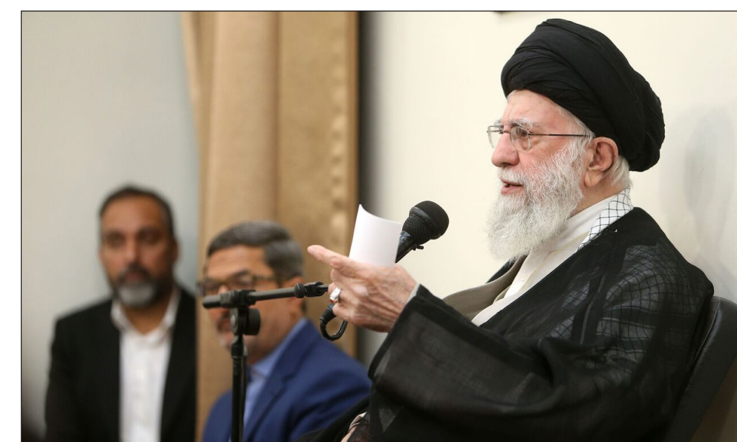
رهبر معظم انقلاب:

حضرت آیت‌الله خامنه‌ای، نمایش توان انقلاب اسلامی در بازآفرینی شور و حماسه ذاتی خود در ابتدای پیروزی را یکی دیگر از ابعاد حرکت مدافعان حرم برشمردند و افزودند: حضور جوانانی که امام و دوران دفاع مقدس را ندیده بودند برای دفاع از حرم، نشان دهنده قدرت عجیب انقلاب اسلامی در بازآفرینی همان انگیزه‌های دینی و انقلابی چهار دهه پیش است.