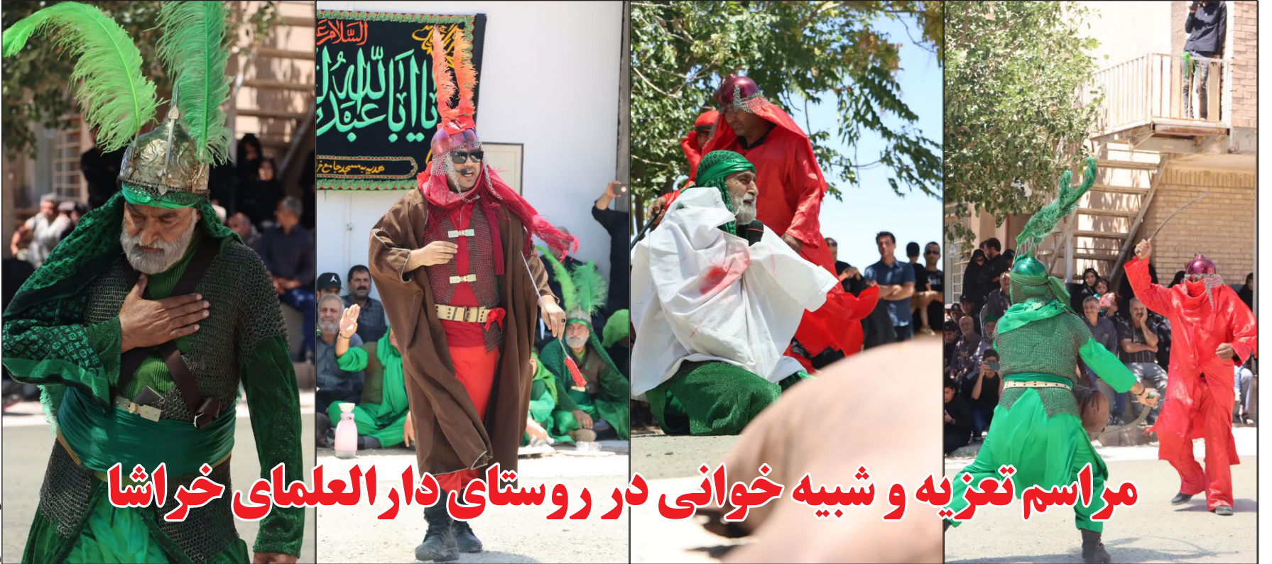
مراسم تعزیه و شبیه خوانی در روستای دارالعلمای خراسا