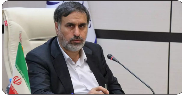
بودیم، اظهار داشت: انتخابات مجلس شورای اسلامی و ریاست جمهوری در راستای تأکیدات مقام معظم رهبری در استان سالم و با مشارکت خوب مردم برگزار شد.

استاندار خراسان شمالی خاطر نشان کرد: با مصوبات سفر رئیس جمهور شهید برای اتمام پروژه‌های نیمه تمام اتفاقات