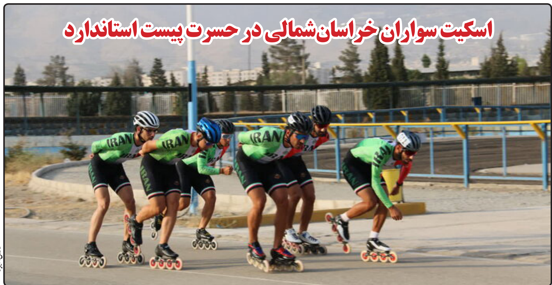
اسکیت سواران خراسان شمالی در حسرت پیست استاندارد

رئیس ستاد اربعین خراسان شمالی: زائران از مسیرهای اصلی پیاده روی اربعین تردد کنند